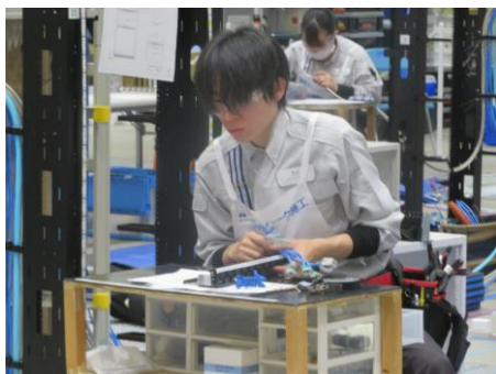
競技模様(元井社員)

今後とも、競技会への参加などを通じ、ミライト・テクノロジーズのさらなる技術力の向上を図り、安全・安心・高品質なサービスの提供に努めてまいります。