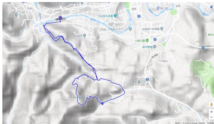
図 2 トレイルタイムレースコース