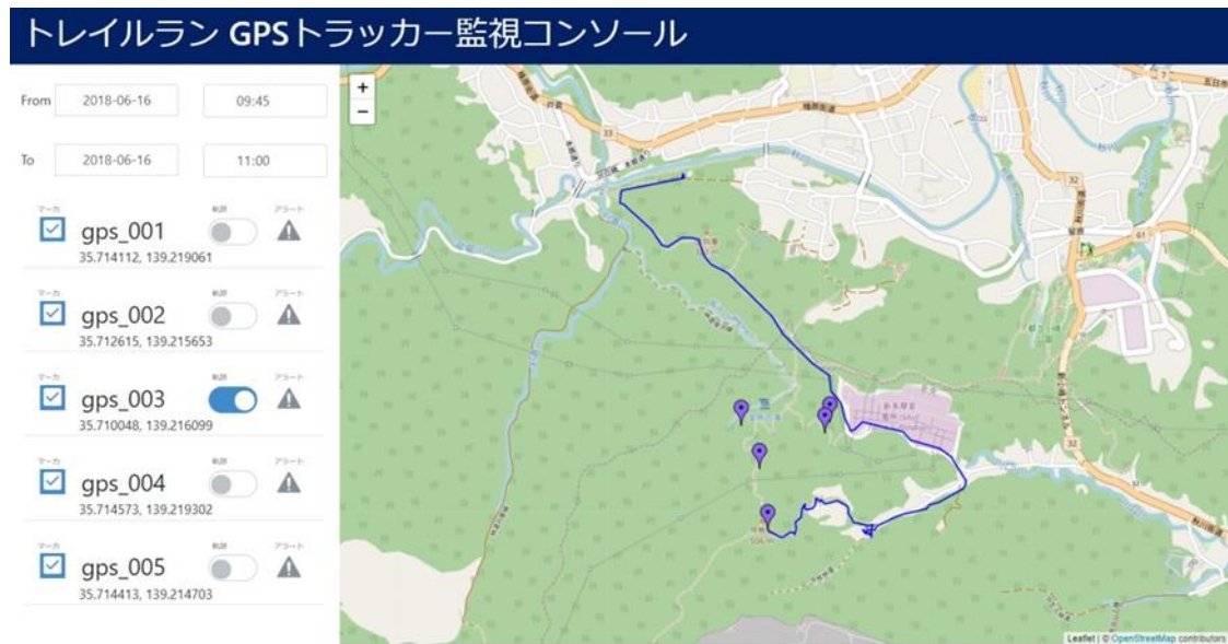
図 1 開発中のランナーtrackingシステム画面 ランナーおよびスタッフの位置情報を取得